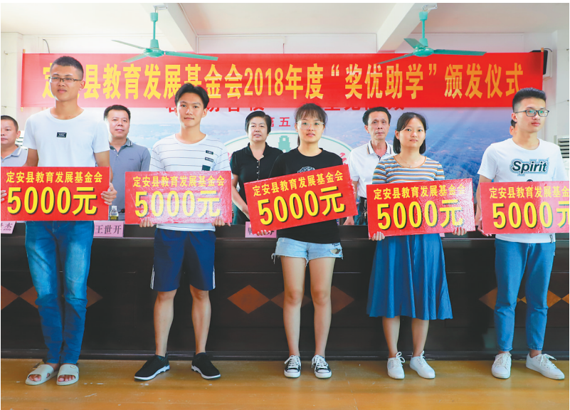
定安县教育发展基金会2018年度“奖优助学”颁发仪式现场。