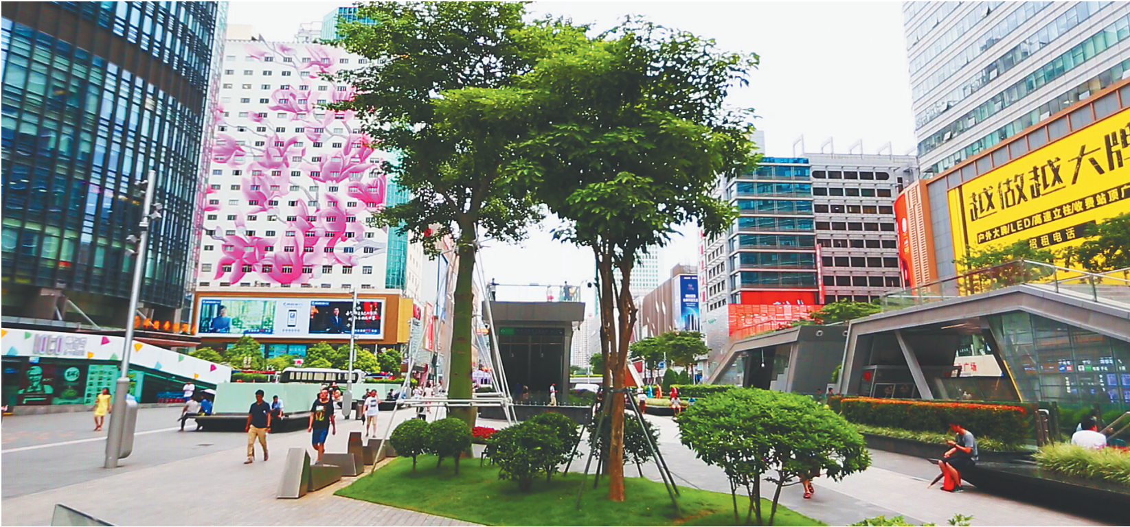
深圳华强北商圈。