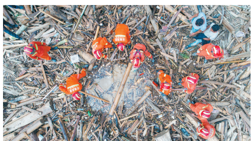
9月4日，救援人员在麻栗坡县猛硐瑶乡坝子桥区域搜寻失踪人员。

新华社昆明9月4日电（记者许万虎 丁怡全）据云南省普洱市政府新闻办4日通报，发生在普洱市墨江哈尼族自治县境内的泥石流灾害造成8人死亡，遗体经过家属辨认和DNA比对后已确认全部找到。 8月29日凌晨，位于普洱市墨江县周安寨村附近在建的玉磨铁路石头寨隧道三号斜井口附近发生泥石流，导致施工驻地工棚被冲毁，现场造成4人死亡、4人失联、2人受伤。 据通报，此次泥石流灾害中的失联人员已全部找到，当地已开展善后和恢复重建工作。