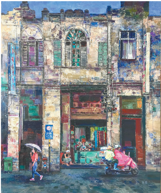
《老街记忆》(油画) 王莉

8月28日,由海南省青年美术家协会主办的第十五届海南省青年美术作品展在海口喜盈门美术馆开幕。虽然展出的部分作品还稍显稚嫩,但其中流露出的蓬勃朝气,显示出本土青年画家探索艺术语言和地域特色孜孜不倦的努力。