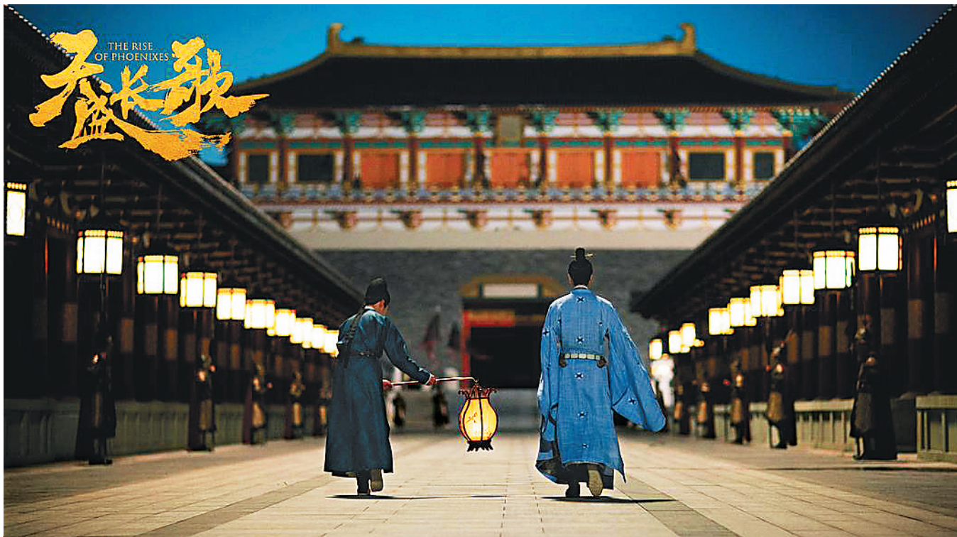
《天盛长歌》的主要取景地在襄阳唐城。

近期,美国流媒体巨头、世界最大收费视频网站 Netflix 宣布购买《天盛长歌》的海外播放权,目前正将其翻译成十几种语言,预计将于9月14日向全球会员播出。