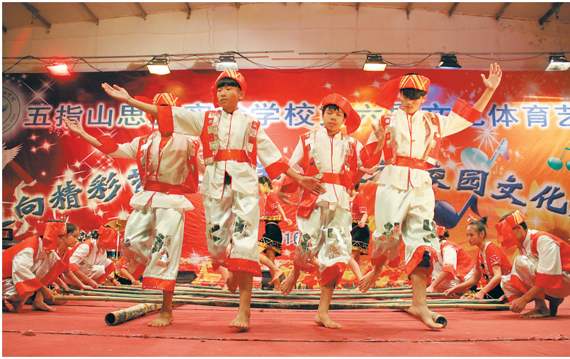
五指山市思源实验学校学生在表演打柴舞。