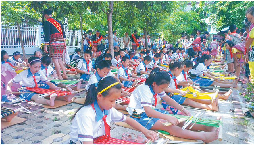
五指山市一小学生在学习织黎锦。