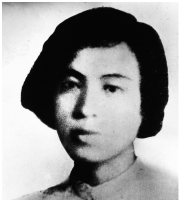
何宝珍像(资料照片) 新华社发

据新华社长沙9月10日电(记者柳玉敏)何宝珍，又名保贞、葆珍，1902年4月出生於湖南省道县。1923年春，加入中国共产党，4月与刘少奇结成革命伴侣。