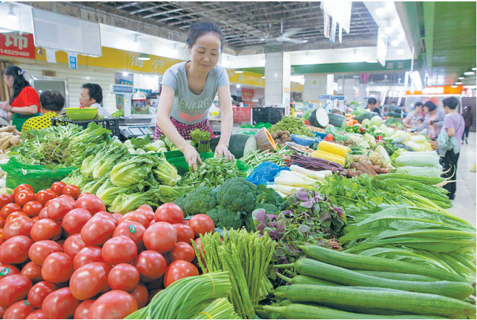
在南京一家农贸市场，一名商贩在整理蔬菜。