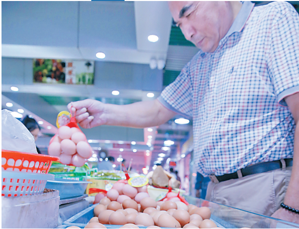
消费者在江苏南通一家菜市场选购鸡蛋。

国家统计局10日发布的数据显示，8月份全国居民消费价格(CPI)同比和环比涨幅均有所扩大，其中鲜菜和猪肉价格环比涨幅较大。专家分析认为，8月份菜价、肉价波动，主要是季节性因素所致，后期食品价格、服务价格、工业消费品价格仍将保持温和水平，通胀压力没有明显增加。