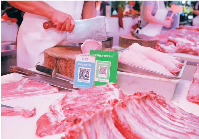
商贩在江苏南通一家菜市场猪肉销售摊位旁切肉。