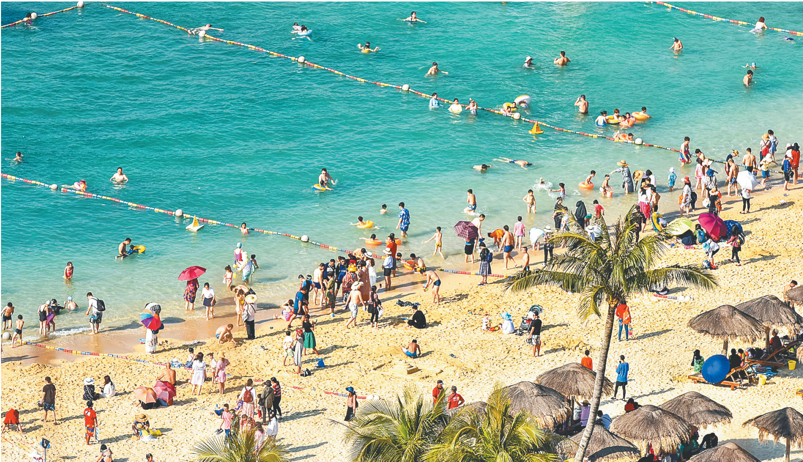
海南分界洲岛旅游区游人如织。

海南日报记者近日采访了陵水分界洲岛、南湾猴岛、椰田古寨、清水湾游艇会、美丽乡村建设发展情况。其中,前三者为陵水传统三大A级景区,是吸引游客的主力;清水湾游艇旅游业则是新兴业态;而在发展全域旅游中,美丽乡村将扮演越来越重要的角色。它们有的面临发展空间受限、产品结构单一问题,有的面临市场培育的挑战,有的须寻找更有效的建设办法。面对问题,各方都积极寻求解决办法,深入谋划长远发展之策。他们的作为和计划,或将影响陵水旅游未来的发展。