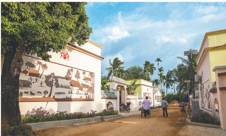
经过民居改造升级的陵水英州镇走所村美丽初显,下一步走所村将发展旅游业。