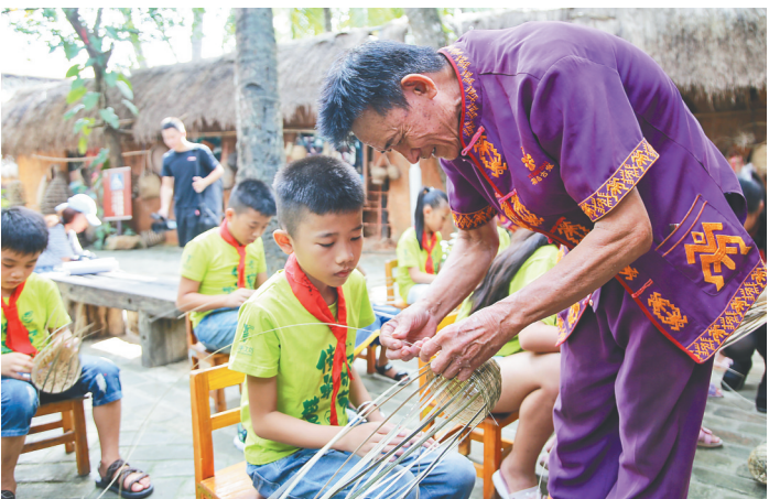
小学生们在椰田古寨景区开展游学活动。