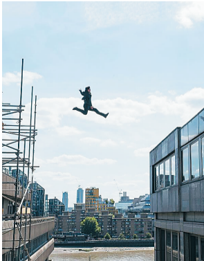
《碟中谍6:全面瓦解》剧照

20余年前,汤姆·克鲁斯和《碟中谍》电影来到中国时,正是中国电影的录像厅时代,那既是动作电影的黄金时代,也是盛行铁血柔情和英雄主义的时代。如今,与汤姆·克鲁斯同时代的观众大多已没有了“凌云壮志”,开始进入老年生活,而这个被称为“阿汤哥”的男人似乎永远不老,依然在继续完成“不可能的任务”。这是光影制造的奇观,也是生命创造奇迹的一个例证。