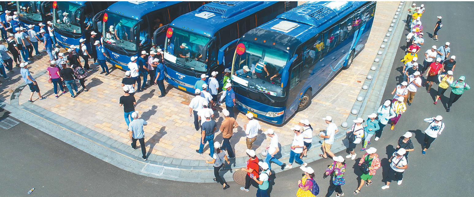
九月十八日,海口市在秀英区海榆中线和民兵训练基地举行防空实案化疏散演练活动。