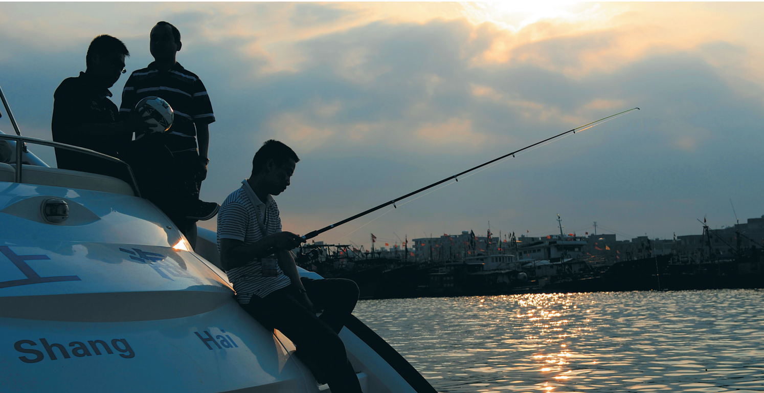
特色一日游里有不少出海垂钓的活动。