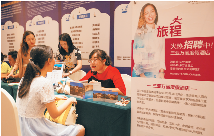
三亚旅游企业在招聘。

“近几年,海南各大景区由于区位优势、薪酬待遇、专业需求等原因出现用工难的现象。”省旅游景区协会秘书长苏群表示。