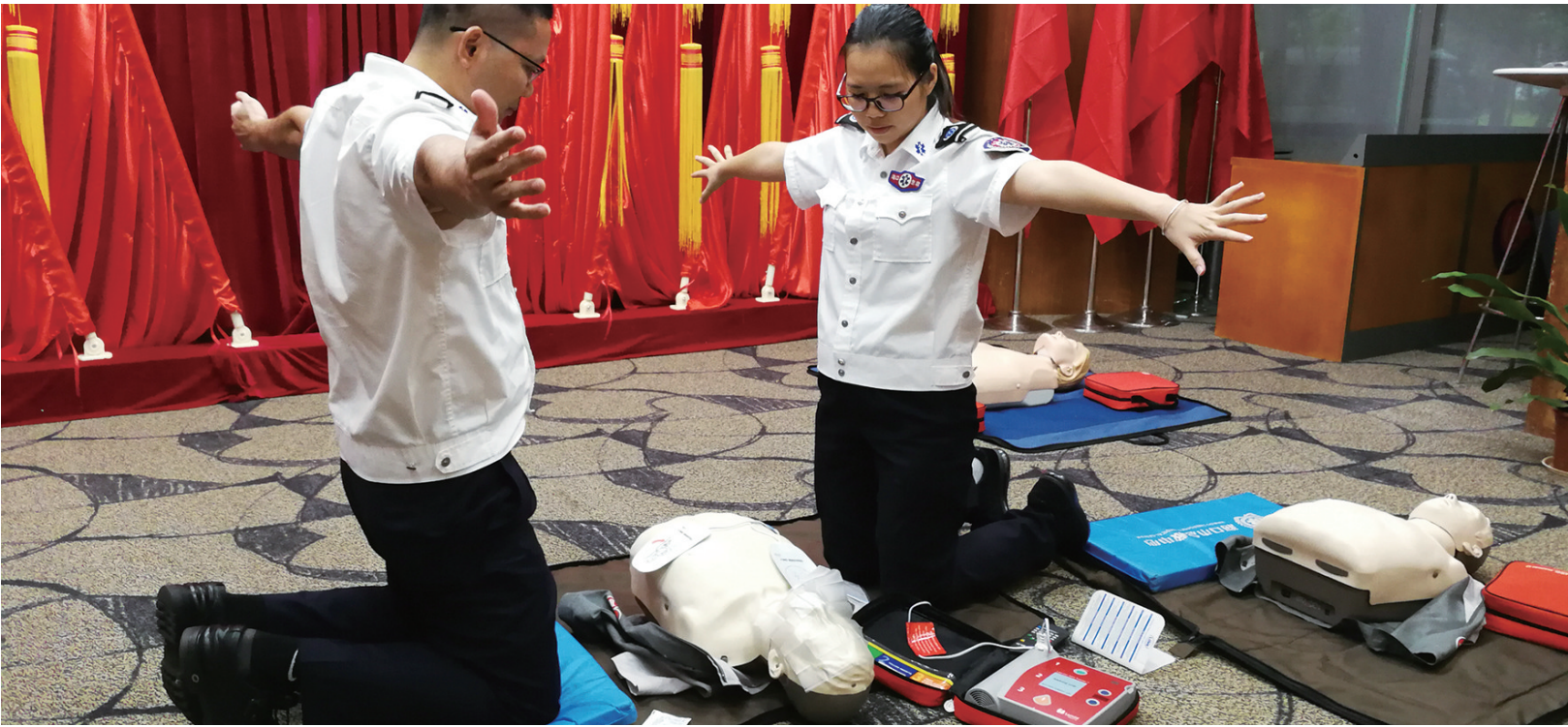
海口市120急救中心培训师演示AED急救方法。

在我国,每年约有150~200万人发生心源性猝死,平均每分钟至少猝死3人。心源性猝死病人早期85%~90%是室颤引发的,治疗室颤最有效的方法是早用自动体外除颤器(AED)除颤。除颤每推迟1分钟,存活率降低7%~10%。