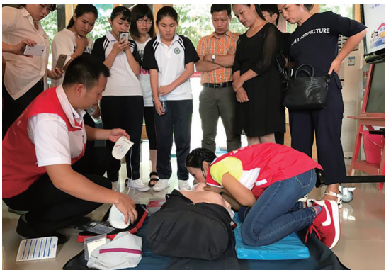
海口市120急救中心进行AED急救知识培训。