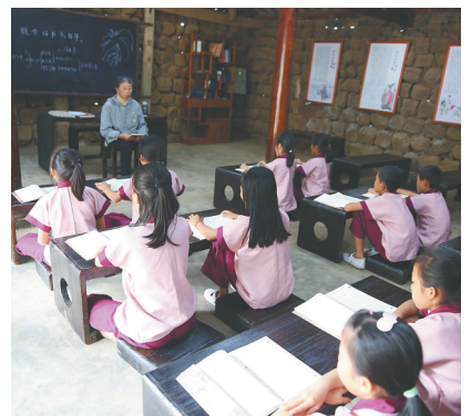
海口冯塘村“国学堂”内孩子们在诵读国学经典。