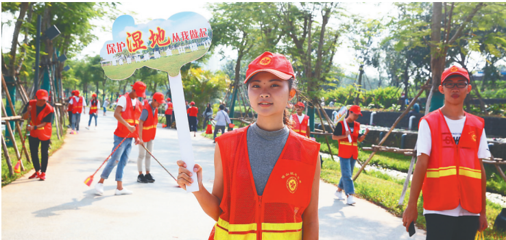
10月1日，海口市美舍河凤翔湿地公园，志愿者清理沿湖垃圾并宣传湿地保护知识。