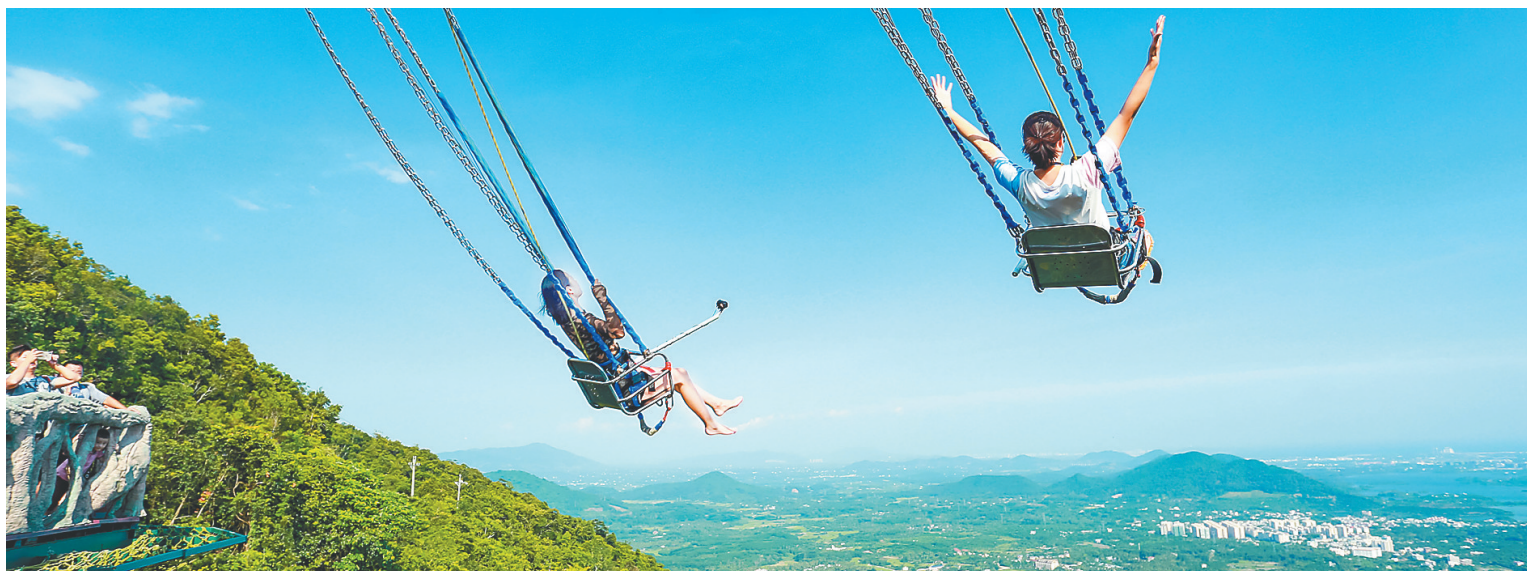
10月4日，保亭呀诺达景区，游客在体验“悬崖观海秋千”项目。