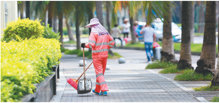
10月4日，海口市滨海大道，环卫工人在清扫路面。

他们的孩子今年3岁，因为夫妻俩工作忙，平时都是由奶奶带着。节假日不能陪在家人身边，这让李国雄夫妻俩对家人心怀愧疚。“每天早上出门时孩子还没醒，晚上回到家他已经睡着，只能亲亲他的小脸。”