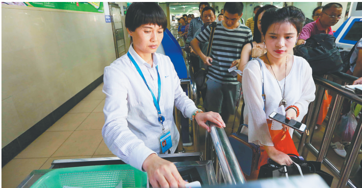
10月3日，海口港，工作人员在为过海旅客检票。

“虽然整个假期都不能回家，但是队员们一句抱怨的话都没有，大家都很卖力。”李和贵说，每天从早上8点半到晚上9点半，工作时间超过12个小时，因为得一直站着，晚上回到房间腿都是肿的，脚上也磨起了水泡。“很辛苦，但是会提醒自己再坚持坚持就好了，为了让‘预约过海’模式能顺利推行，所有的付出都是值得的。”