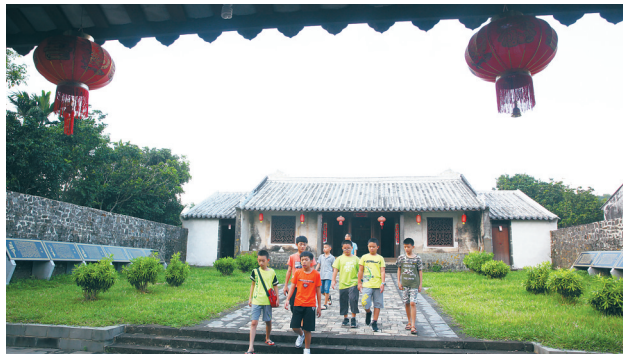
↑10月3日,游客们参观游览定安县龙湖镇高林村。