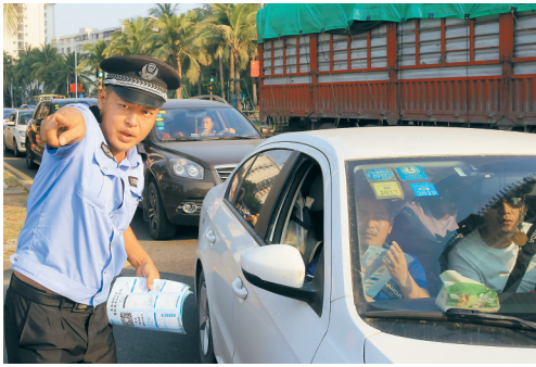
10月6日,海口在各个港口安排了交警、志愿者等人员,保障旅客顺利返程。