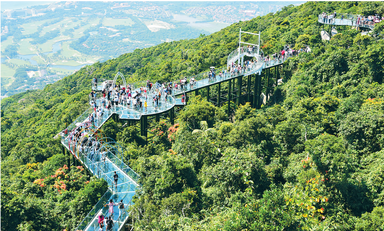
10月4日,三亚亚龙湾热带天堂森林旅游区,游客在玻璃栈道上游览。