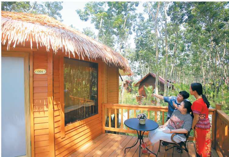
10月6日,白沙黎族自治县七坊镇阿罗多甘共享农庄,游客在林中木屋享受休闲时光。

“生态景观很好,体验项目也很有特色,今后有机会还会邀上朋友过来住几天。”广西游客詹明说。今年国庆假期,白沙生态游人气旺。在白沙原生态茶园小镇,游茶园、对唱采茶山歌等节目轮番上演;在邦溪镇芭蕉村,游客们不仅能免费品尝黎家米酒,还能与村民齐跳竹竿舞。(本报牙叉10月6日电)