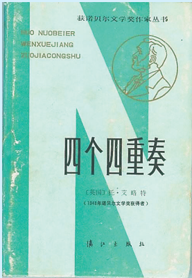
艾略特作品《四个四重奏》