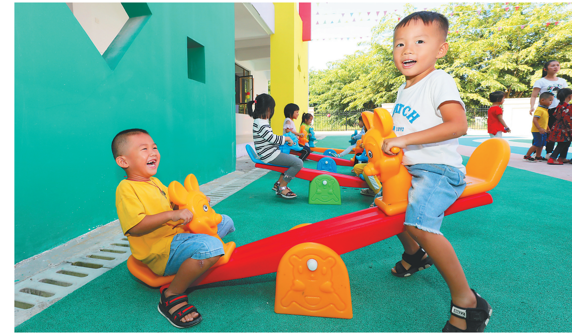
十月八日，小朋友们在陵水桃园幼儿园玩游戏。

本报椰林10月8日电（记者李艳玫 通讯员陈冰 陈思国）10月8日，陵水黎族自治县机关幼儿园（新园区）（以下简称新机关幼儿园）和桃园幼儿园同时开园。