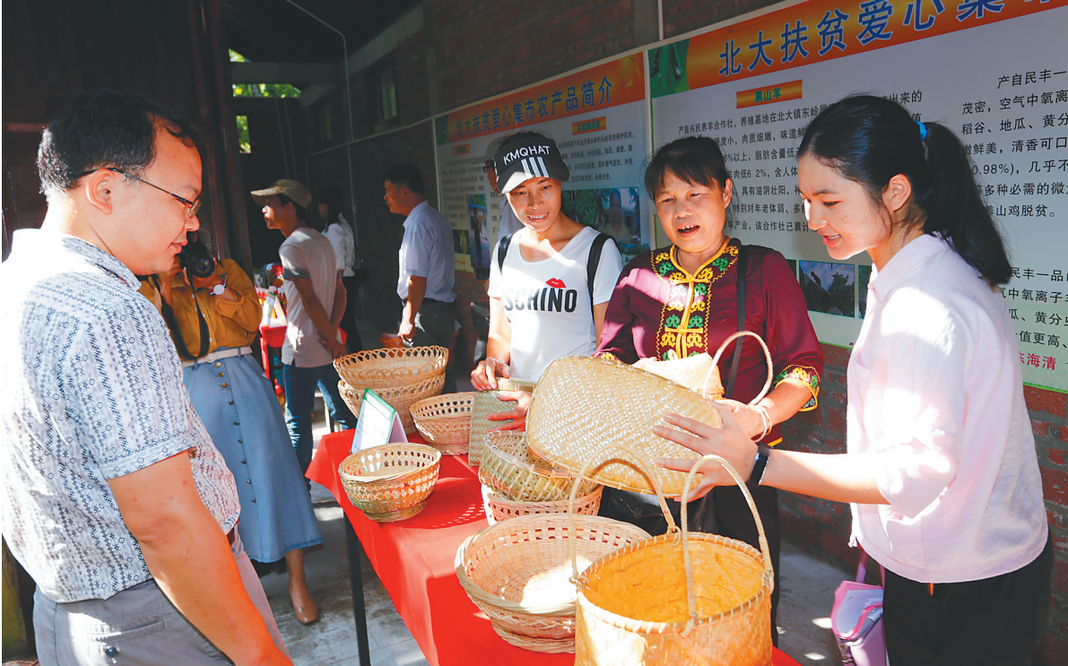
万宁市扶贫爱心集市现场，消费者在选购竹编制品。

“举办扶贫爱心集市是万宁解决扶贫产品销售难问题的一次尝试。”万宁市扶贫办相关负责人透露，本次扶贫爱心集市共收集了4大类21种优质农特产品，其中竹编、海鲜、蜂蜜、鸭鹅等农特产品受到热捧，“扶贫爱心集市的火爆让很多合作社与贫困户坚定了生产信心，也有不少消费者反馈希望有更多类似的活动，上架更多的优质农特产品。事实上，我