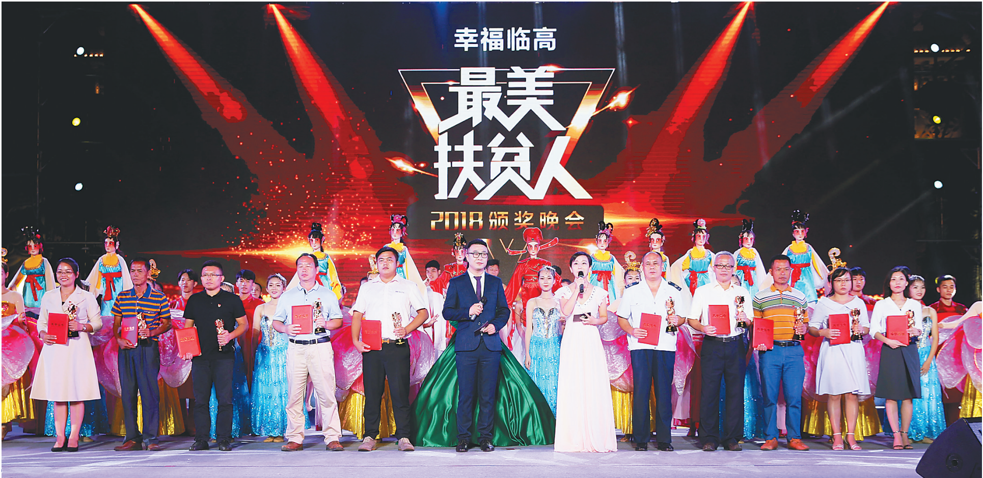
10月17日晚，临高“最美扶贫人”颁奖晚会在临城镇拉开帷幕，10位个人和集体获奖者亮相。

本报临城10月17日电（记者刘梦晓）10月17日晚，在临高县临城镇，一曲欢快的歌舞——《田野的希望》拉开了2018年度临高“最美扶贫人”颁奖晚会的帷幕。一个个亲切熟悉的名字，一个个透着泥土芬芳的故事，让现场观众更加了解临高扶贫领域的典型人物和集体，以及他们在扶贫路上感人的点点滴滴。