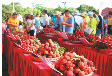
海口市秀英区永兴镇举办荔枝王比拼大赛。 本报记者 张茂 摄

21世纪海上丝绸之路战略支点城市的核心区 大南海开发区域中心城市的新都区 新兴产业和特色产业的聚集区 全国生态文明建设先行区和海南“首善之城”示范区