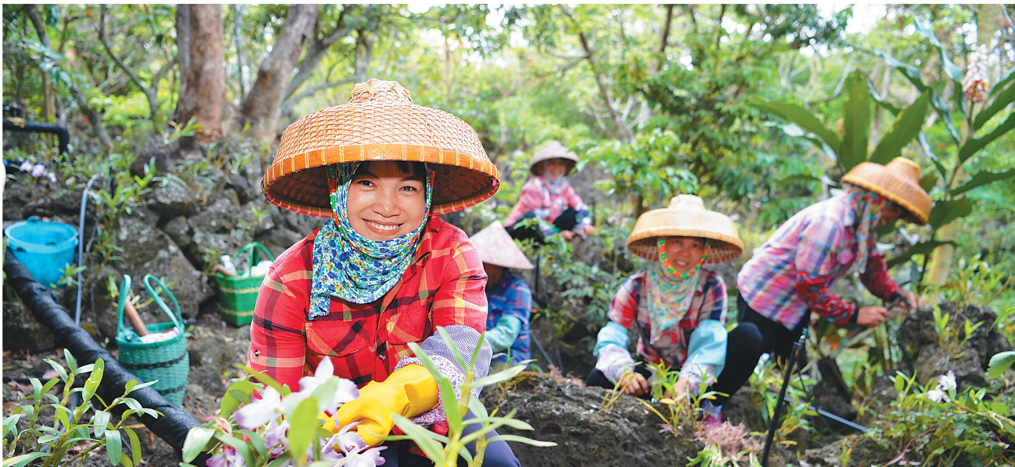
海口市秀英区石山镇施茶村村民在火山石上种植石斛。