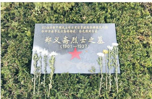
位于河南省许昌市的郑义斋烈士墓。

据新华社郑州10月21日电 在中国工农红军的历史上，有一位被称为“红色理财专家”的革命家，他就是红军杰出的后勤工作者郑义斋。 郑义斋，原名郑少文。1901年生，河南许昌人。1927年加入中国共产党。1930年在上海，以“义斋钱庄”经理身份作掩护从事秘密活动，从此改名郑义斋。 1932年春奉命赴鄂豫皖苏区，任鄂豫皖省工农民主政府财政委员会主席兼工农银行行长，红四方面军经理处处长。他是一个出色的后勤工作者。 1933年2月起任中共川陕省委员，川陕省工农民主政府财政委员会主席，省工农银行行长，红四方面军总经理部部长兼兵工厂、造币厂厂长。 川陕革命根据地建立以后，作为川陕革命根据地财政经济工作主要领导人的郑义斋，在发展苏区的经济建设中做出了重要贡献，被同志们誉为“红色理财专家”。