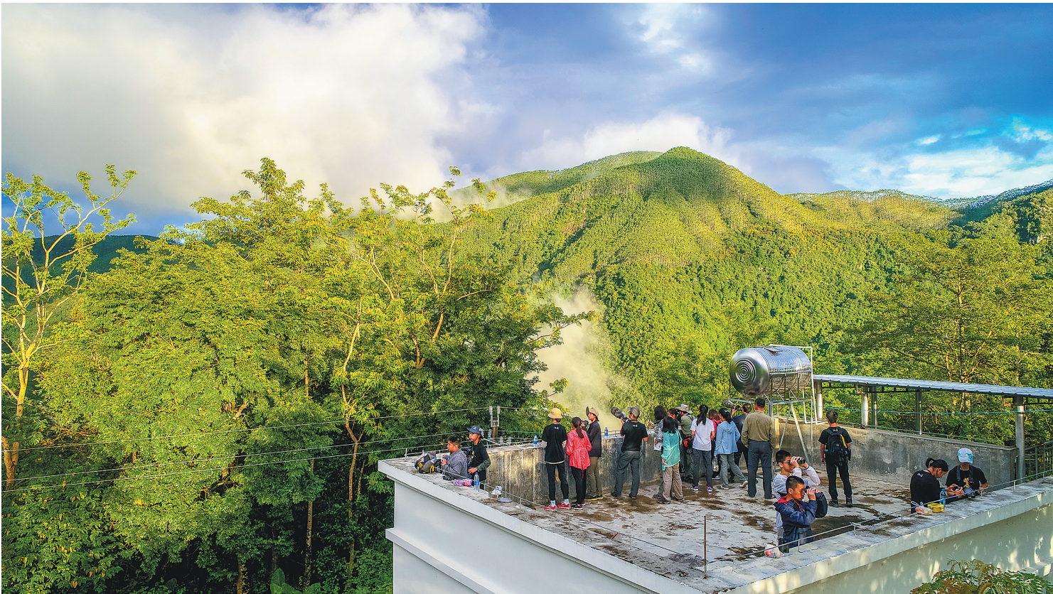
学生们在鹦哥岭国家级自然保护区开展研学旅行。

为了推动我省中小学生研学旅行实践教育基地建设，今年6月至8月，省教育厅联合省旅游和文化广电体育