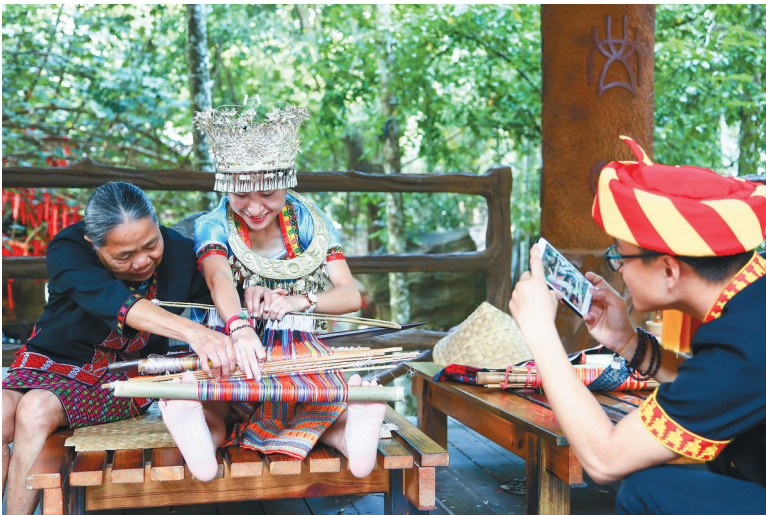
游客在海南槟榔谷黎苗文化旅游区感受民族文化的魅力。

“依靠优质的旅游资源，分界洲岛成为《爸爸去哪儿》《不可思议的妈妈》等亲子类综艺节目的取景地。但是，海洋剧场里的海洋动物、