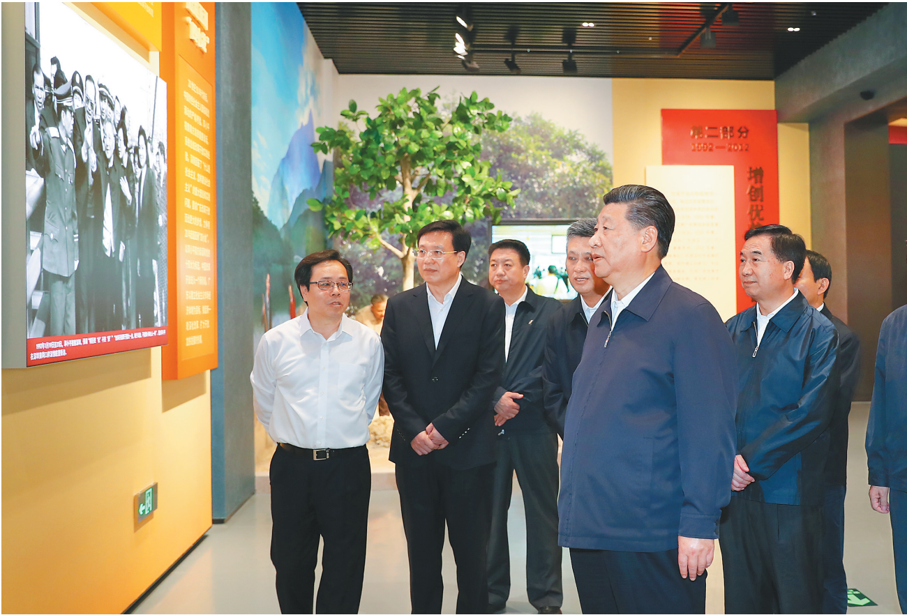
10月22日至25日，中共中央总书记、国家主席、中央军委主席习近平在广东考察。这是10月24日上午，习近平在深圳参观“大潮起珠江——广东改革开放40周年展览”。