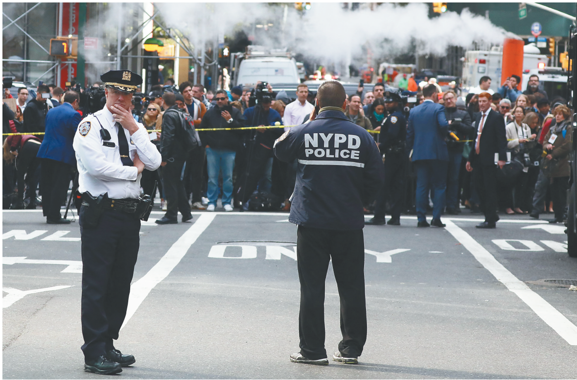
10月24日,在美国纽约,警察在时代华纳中心大楼外执勤。

反移民强硬立场…… 10月最后一周还会出现什么“惊奇”尚难预料,中期选举前景也仍存变数。唯一清晰的是,众口难“合”,美国政治极化与社会分裂更加昭然。 (新华社华盛顿10月25日电)