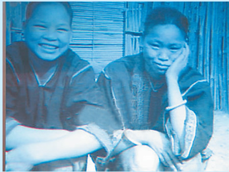
《海南红山之外》的电影画面。

与此同时,为了纪念海南岛解放50周年以及中国共产党成立90周年,中央电视台在2010年和2011年先后播出大型文献纪录片《日出琼崖》和《浴血琼崖》。《日出琼崖》采用纪实手段,又巧妙地借鉴了电视剧的表现手法,集中展现人民解放军渡海解放海南岛这几个月历程,获得受众的高度赞许,被中国广播电视协会评为一等创优系列专题片。与《日出琼崖》不同的是,《浴血琼崖》则聚焦于23年琼崖革命史,以冯白驹等重要人物为切入点,全景式地表现出了爱国华侨、琼崖妇女、黎族同胞等社会各界对琼崖革命的大力支持,在视听盛宴中将主流价值观传达给大众。用纪录片的形式向年轻一代叙说革命历史,传递主流价值观,可以说是一种新的尝试,值得进一步推广。