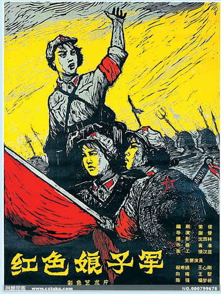
《红色娘子军》手绘海报