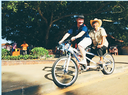
《遇见海南人》斩获伦敦国际华语电影节大奖