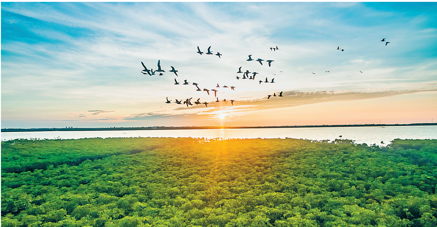
海口市演丰镇,东寨港红树林湿地公园。

北濒琼州海峡,地处海南岛北部,自古以来,“水城”海口的发展与湿地、水系密不可分。