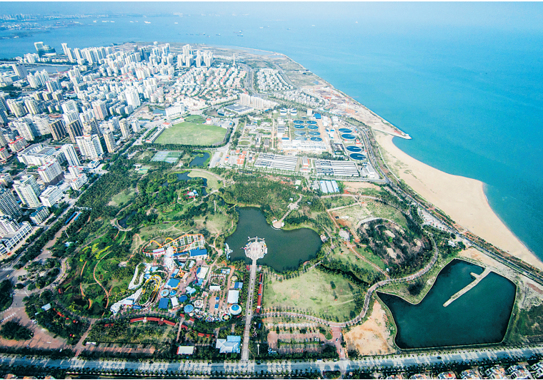
鸟瞰海口市美兰区海甸岛白沙门公园。这里北临琼州海峡,是候鸟“登陆”海南岛的第一站,也是海口市区最有“野趣”的生态公园。