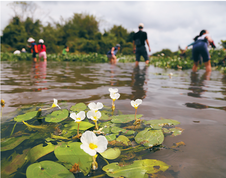
“松鼠学堂”曾组织志愿者到海口那央村清理水葫芦,抢救水菜花。

10月25日,海口荣获全球首批“国际湿地城市”称号的消息传来,高高在微信朋友圈里晒出了图片,并写到:“来之不易、与有荣焉。”