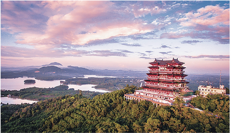
背倚“突兀隘空”马鞍岭，直面“儋州母亲河”雅拉河 南眺“黎母明珠”云月湖