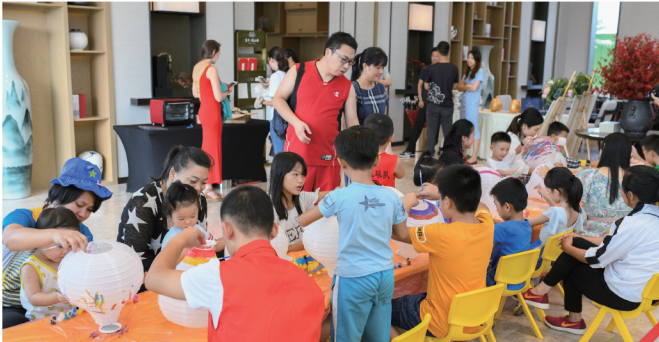
图中孩子们正在上一堂热气球涂鸦的手作课

连续两天，整个富力·阅山湖营销中心内外热闹非凡。带着对美的憧憬，千余儋州市民轮番乘坐了热气球，从空中俯瞰了马鞍岭、雅拉河与云月湖交织的大美画卷，充分感受了城市之美、自然之美与热气球运动之美。 户外活动人气居高不下，室内新中式风格陈设的“右岸书社”也同样让不少来宾大为赞赏，庆幸儋州终于有了匹配千年文化底蕴的生活配套。