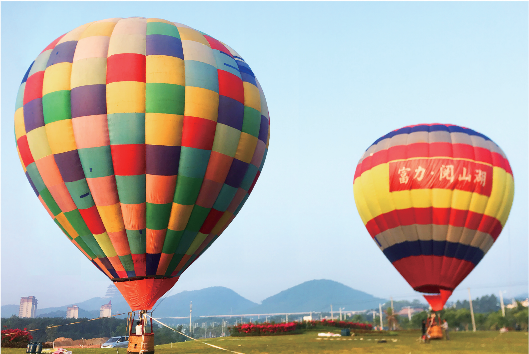
数千位儋州市民参与并乘坐了热气球，从高空视角观赏了千年儋州的大好湖山