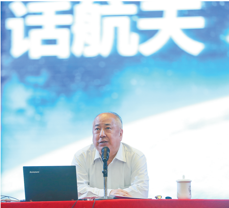
10月29日下午,钱学森之子、钱永刚教授在海南中学以“航天科技”为主题为师生们作讲座。

书屋揭牌仪式、衍林书屋揭牌暨文化、学校运动会、校友捐赠校史照片、捐助学生社团和女足发展