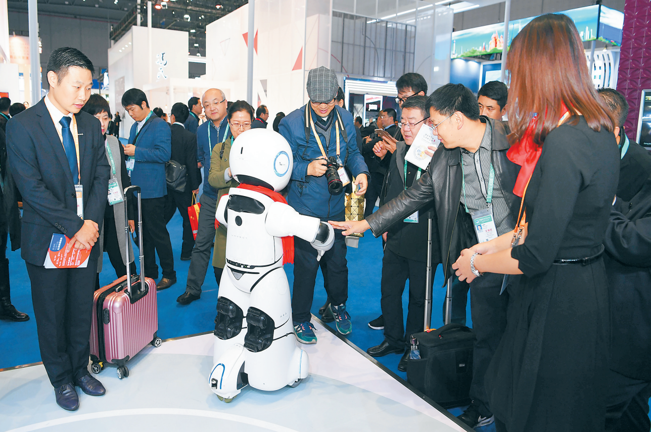
11月6日，首届中国国际进口博览会，一家公司生产的机器人与参观者互动。

据介绍，近年来，海南农垦已分别与泰国、马来西亚、新加坡、柬埔寨等国的企业推进多领域合作，布局天然橡胶等热带农业全产业链。海南农垦还从东南亚国家引进目前海南仍未种植或未形成规模的热带高效水果，通过试种、示范、推广，推动海南热带水果产业化发展；积极推进中柬胡椒产业示范园项目，努力为胡椒产业发展注入新动力。“下一步，海南农垦将紧紧抓住‘一带一路’建设契机，全力推进与各国企业在天然橡胶、南繁育制种、热带水果、草畜养殖等领域的合作。”杨思涛说。