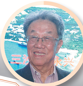
南海风景，文苑葱茏。贺《海南周刊》十年。 ——作家王蒙