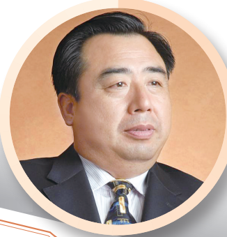
我在北京祝贺海南日报《海南周刊》创刊十周年。你们激情岁月，筑梦十年，坚持为读者办刊，为艺术扬帆，祝海南日报《海南周刊》越办越好，为新时代谱写新的篇章。 ——书法家翟鑫