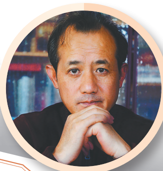
恭贺《海南周刊》十周年！副刊文丛如能出一本讲述海南故事的书，那该多好！期待中！ ——作家李辉