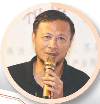
十年来，《海南周刊》都是海南最重要的文化阵地之一，尤其是在高雅文化和大众文化之间搭建起一座沟通的桥梁。作为阅读了这十年几乎每一期周刊的读者，有理由说自己更了解海南一些，也更了解世界文化一些；有幸作为周刊的撰稿人，能够在周刊的万花丛中增添一道小小的风景，也与有荣焉。希望这扇窗开得更大，更加透亮，成为海南自贸区、自贸港的一张靓丽名片。 ——评论家马良