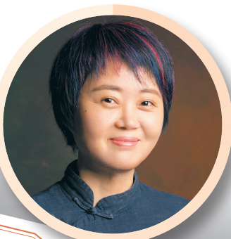
大海的襟怀，南方的气候，所以《海南周刊》能一直面朝大海，春暖花开…… ——作家周晓枫