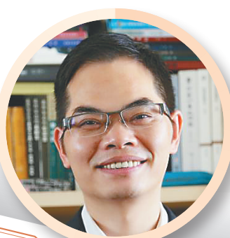
《海南周刊》，汇集天南地北，凝聚古今中外。 ——作家金满楼