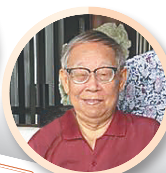
文化的历史延续和基因传承，在一个地区的发展中有着特别重要的意义。《海南周刊》这些年来，在这方面做了大量的传播和传承工作，其功不可没。周刊上的许多文章，朴实、自然，读之令人感到真切以至浮想联翩。周刊，已成为承载感情记忆的精神家园。 ——学者王春煜