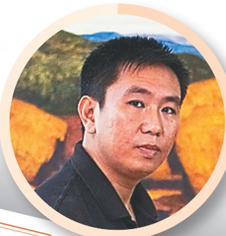
海纳百川的历史积淀与融合，海南地域文化精神的家园。 ——画家王锐