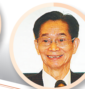
发掘海南地区优秀文化，充当思想文化高地守护者。 ——学者叶显恩