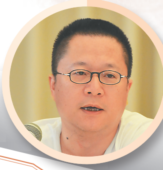
《海南周刊》，海阔天空的文化平台，愿永远包容八面来风！ ——诗人李少君