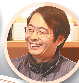
海上生明月，十年光渐满。相看两不厌，天涯有婵娟。 ——诗人西渡