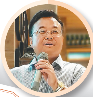
沁园春·海南周刊十周年志庆 《海南周刊》，十年风雨，铸就辉煌。爱语词典雅，版面清新，图文并茂，溢彩流光。讲读博厚，乐活机趣，文苑艺术扑面香。更难得，有随笔耐读，锦绣篇章。 行走无限风光。海之南，访谈兴味长。看五指山下，红花闪烁，万泉河畔，渔歌悠扬。黎苗山寨，调声优美，音律谐婉颂家乡。共祝愿，创文化胜境，承继汉唐。 ——作家马向阳