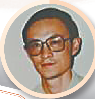
在报界独树一帜，乃积淀人文史地的高地，与海南共同成长，是记录社会情怀之先锋。 ——作家伍立杨