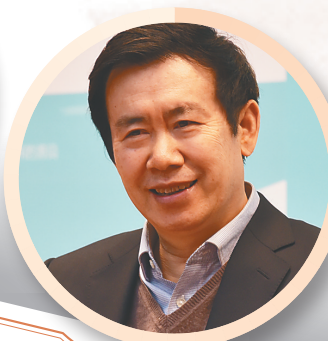
南国沃土上茁壮生长的一枝精神之花，芬芳四溢。在未来的岁月里，她将愈加妍丽，为越来越多的读者朋友所珍爱。 ——作家张伟