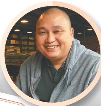
读《海南周刊》，知海南文化历史大事。在《海南周刊》上相遇阅读、影视、时尚，从不同的角度诠释“大美海南”。在阅读多元化的今天，《海南周刊》坚持文化理想，奉献精彩大餐，让读者感受到海南风景实录，实则是对海南的文化形象塑造有着巨大的贡献。 ——作家朱晓剑