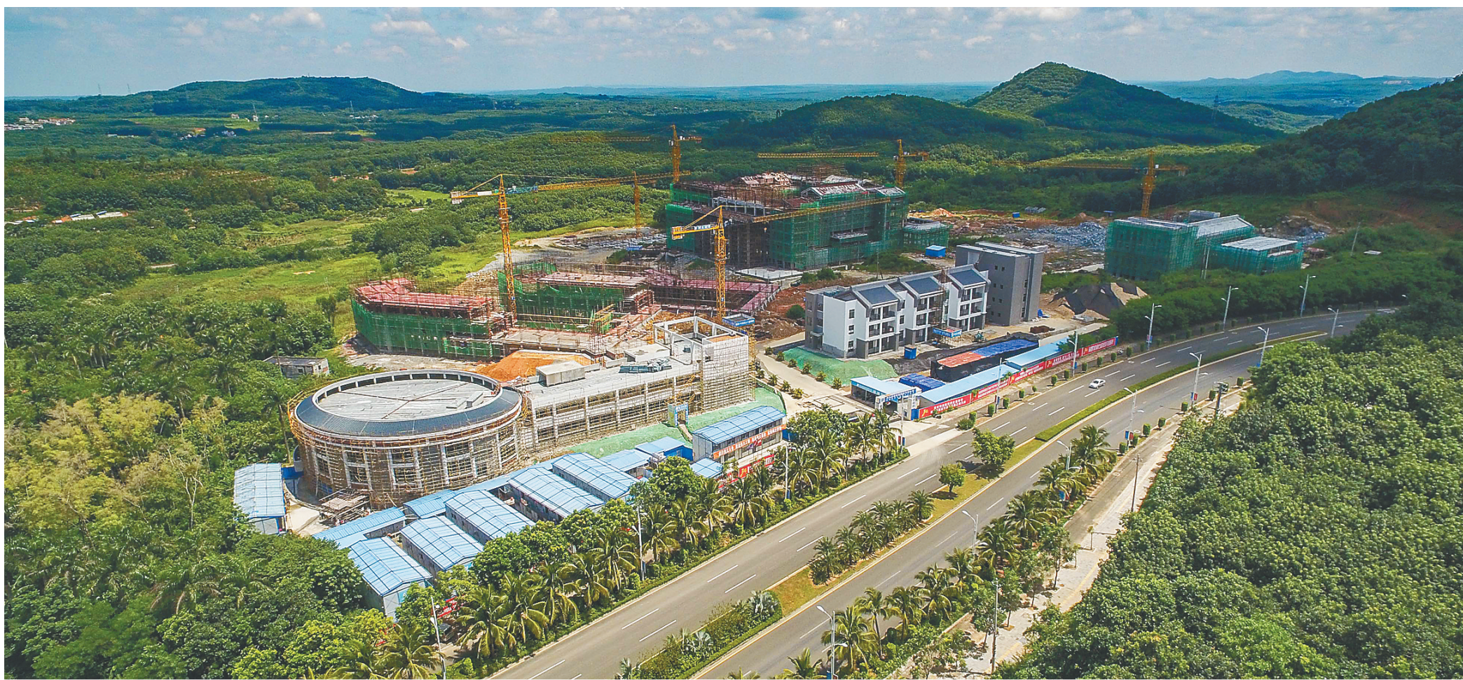
海南西部中学项目建设正在如火如荼施工中。