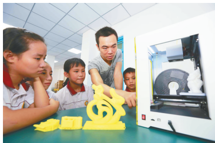
白马井小学开设3D打印课堂。