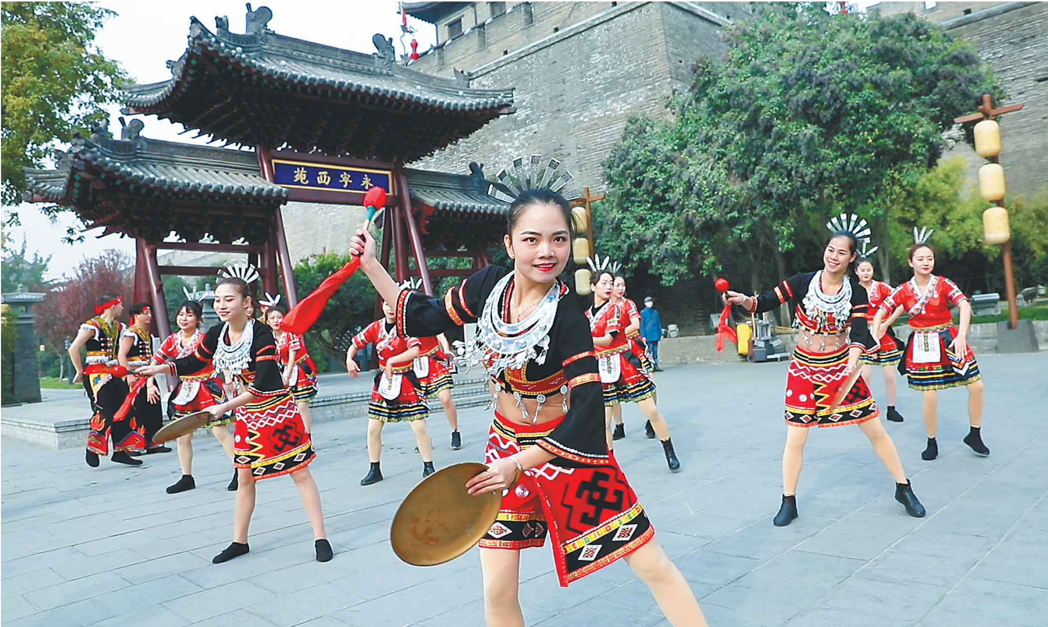
昌江黎族阿哥阿妹在西安古城墙下开展黎族文化“快闪”活动。