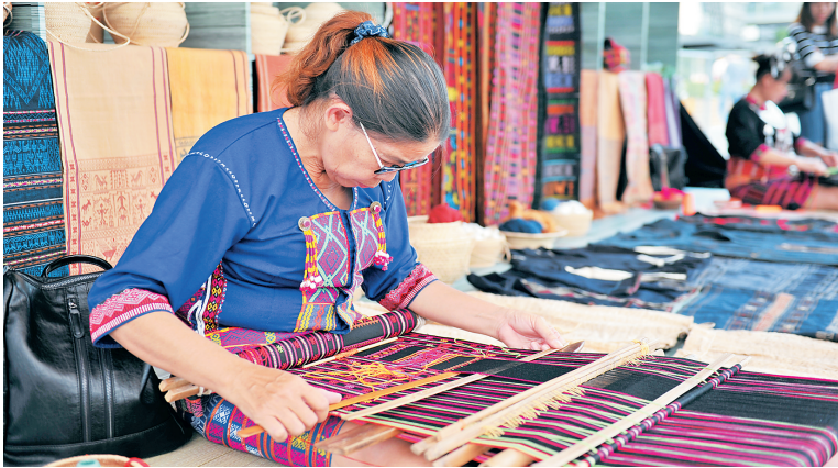
推介活动现场展示黎族织锦技艺。