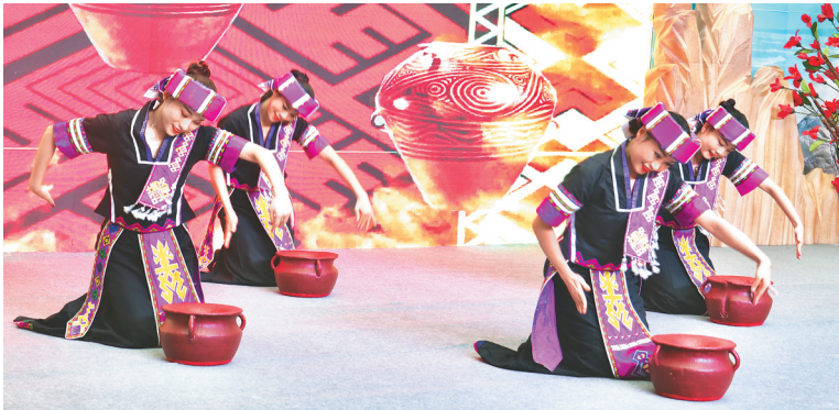
推介会上的黎族舞蹈表演。