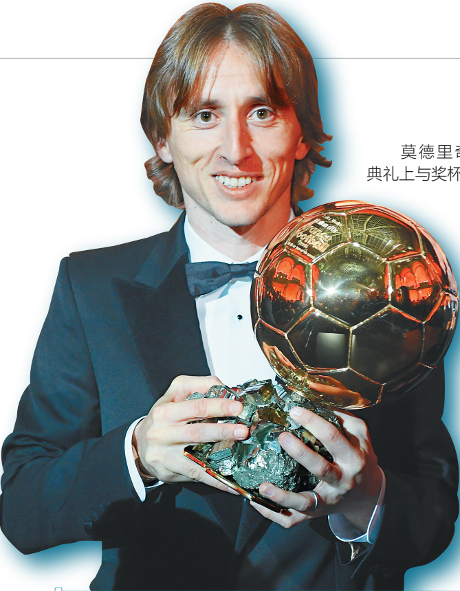
莫德里奇在颁奖典礼上与奖杯合影。

“金球奖”由《法国足球》杂志于1956年创立，结合球员一整年表现，由足球专业记者投票选出。