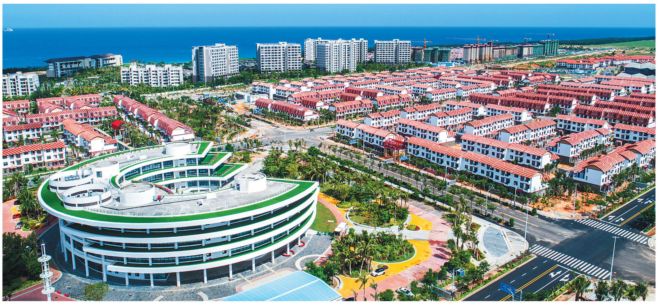
陵水黎安海风小镇。