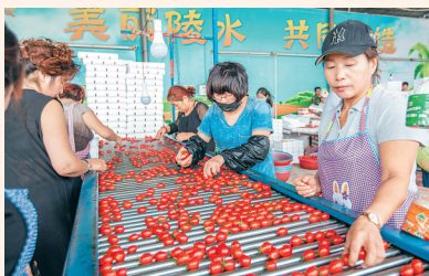
在陵水黎族自治县光坡镇武山村圣女果收购点,工人忙着分拣新鲜的圣女果。

目前,陵水共有5家省级现代农业园。陵水农委相关负责人表示,今后将继续组织3家企业申报省级现代农业园,全力推进安马洋南繁基地、鲁宏荔枝标准化示范基地建设。同时,将推进陵水现代农业示范基地的生产示范区20万平方米智能大棚建设,带动更多农户从现代生产中受益。(本报椰林12月4日电)