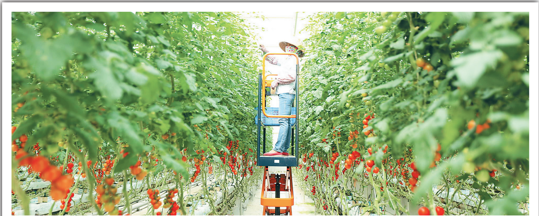
陵水现代农业示范基地。