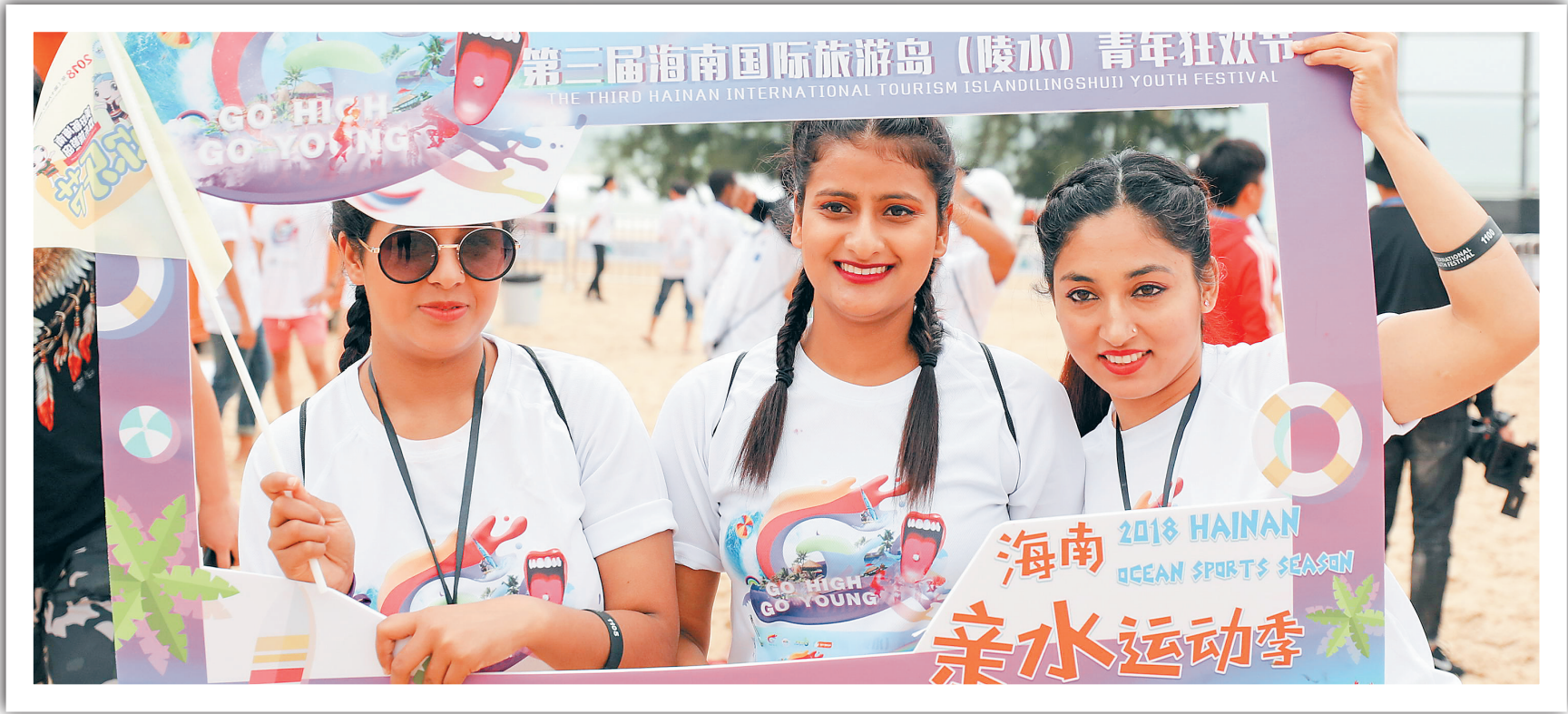
在陵水清水湾举办的青年狂欢节吸引大量国内外游客。