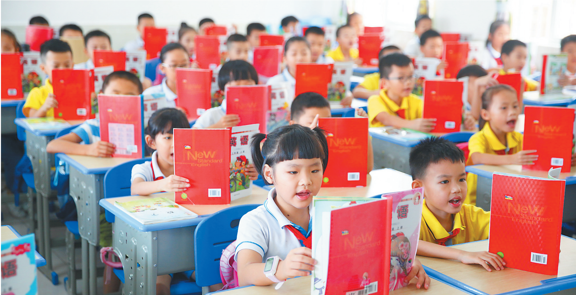
二〇一八年九月十八日,海口市琼山第三小学三年级学生在配备有可升降课桌椅的教室里上课。