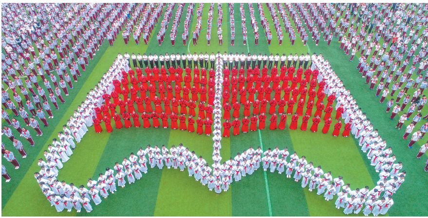
2018年世界读书日前夕,海口市玉沙实验学校师生身穿传统汉服摆出“书”造型,诵读经典古诗词。

教育是最大的民生,是面向未来的事业。改革开放40年来,特别是党的十八大以来,海南省委、省政府把教育事业放在优先位置,推动教育改革取得了历史性成就和跨越式发展。 全省教育系统牢牢把握社会主义办学方向,全面贯彻党的教育方针,落实立德树人根本任务,在发展素质教育,培养德智体美全面发展的社会主义建设者和接班人上下了很大功夫,取得了显著成效—— 教育普及程度得到大幅提升,教育公平取得重大进展,职业教育和高等教育在转型发展、服务经济社会方面也迈出了坚实步伐。值得一提的是,我省还确立了“全上学、全资助、上好学、促成长”教育精准扶贫十二字目标,有力保障了建档立卡贫困户的孩子无人因贫失学。 当前,海南迎来了建设自由贸易试验区和中国特色自由贸易港的重大历史机遇,教育部亦明确将海南作为国家教育改革开放的四大战略支点之一,要求海南打造中国教育对外开放新标杆,为全省教育系统进一步深化改革开放指明了方向、提出了要求。 当下的海南,处处墨香四溢、书声琅琅,开放的环境吸引着国内外优秀师资和教育项目来琼。他们的到来,必将为海南办好人民满意的教育,让广大师生更有获得感、幸福感作出贡献。