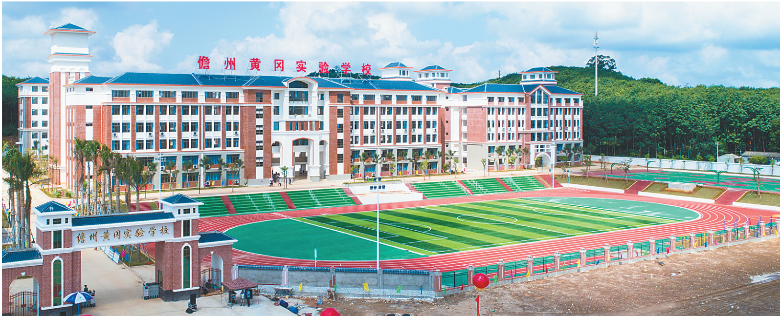
2017年8月21日,儋州黄冈实验学校揭牌运行。这是一所12年一贯制寄宿制学校,是我省大力引进好校长、好教师项目的成果之一。