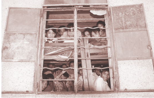
2004年6月,乐东黎族自治县抱由镇永明中心小学,一群学生聚在简陋而拥挤的宿舍里。