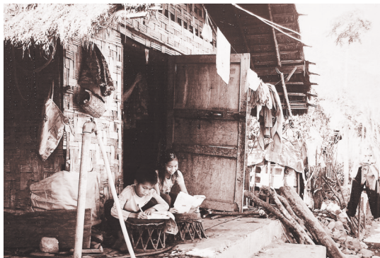
实施教育扶贫移民工程之前,昌江黎族自治县王下乡下小学学生在简陋的教室外学习。 (资料图片)