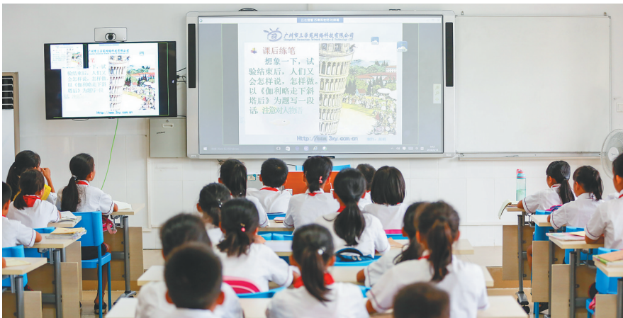
2018年6月14日,陵水黎族自治县椰林镇第三小学的学生们通过“同步课堂”与当地的中山小学学生一起上课。