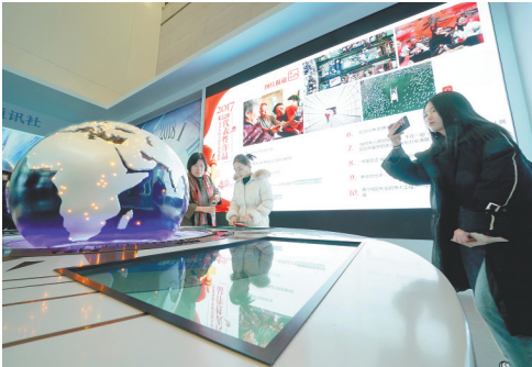
12月5日,观众在新华社主办的“新华社的经典报道”展台参观。

截至当日,在中国国家博物馆举行的“伟大的变革——庆祝改革开放40周年大型展览”累计参观人数接近100万人次。