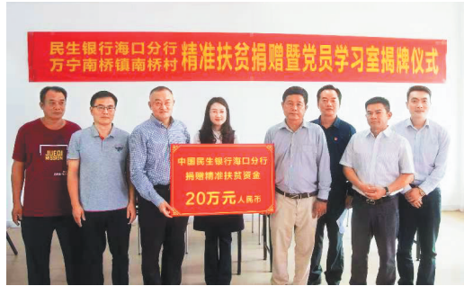
捐赠仪式现场。

本报讯(记者王培琳 海报全媒体中心记者汪慧 通讯员冯炯)近日，民生银行海口分行在万宁市南桥镇南桥村开展精准扶贫捐赠暨党员学习室揭牌仪式，现场为南桥村捐赠20万元精准扶贫资金及20万元党员学习室办公家具，助力南桥村脱贫攻坚工作。