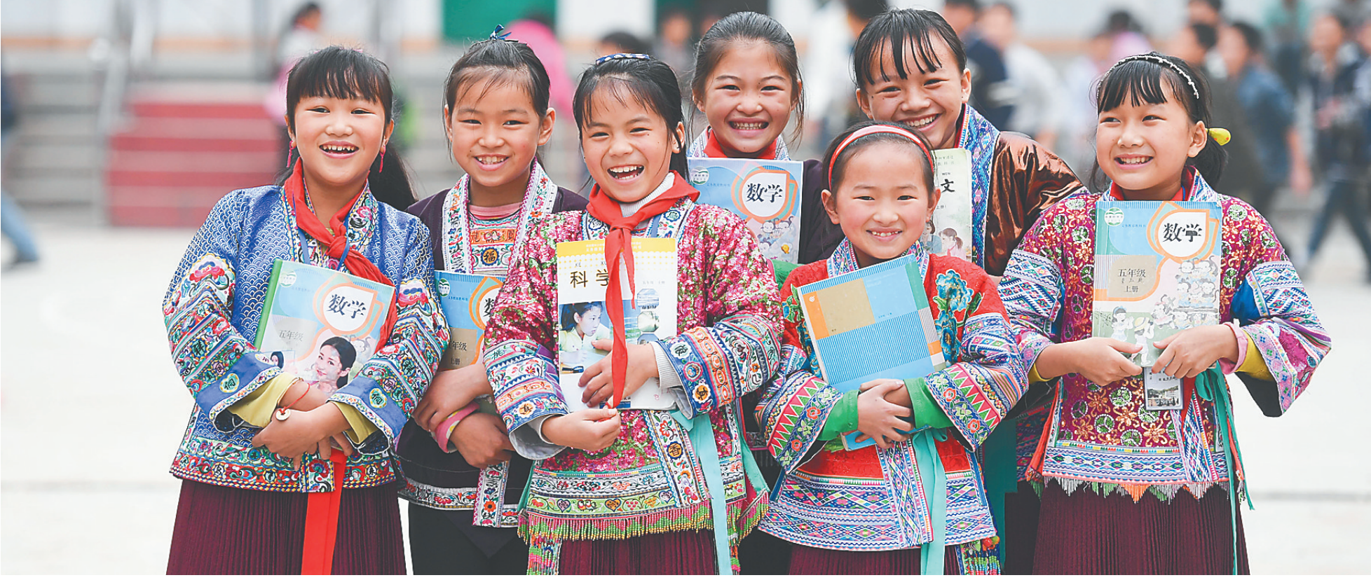
广西融水苗族自治县白兰乡中心小学红瑶女童班的各族女童。

历史，总在变革中迸发前进的力量。改革开放40年间，民生加快改善，社会治理不断完善，“以人民为中心”的理念闪耀在中国共产党的时代答卷。“面对人民群众新期待，我们必须坚定改革开放信心，以更大的政治勇气和智慧、更有力的措施和办法推进改革开放，进一步解放思想、解放和发展社会生产力、解放和增强社会创造活力。”习近平总书记的话语，昭示着中国共产党始终不渝的追求。