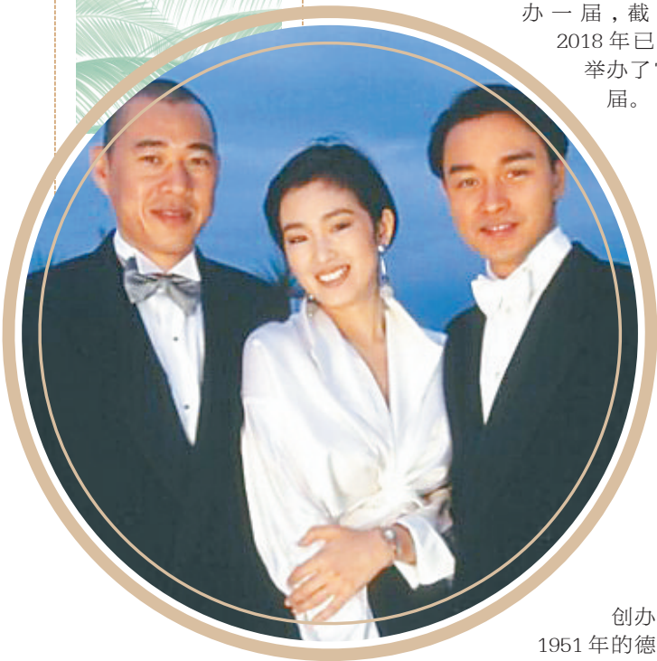
1993 年,《霸王别姬》的主演们参加戛纳电影节。