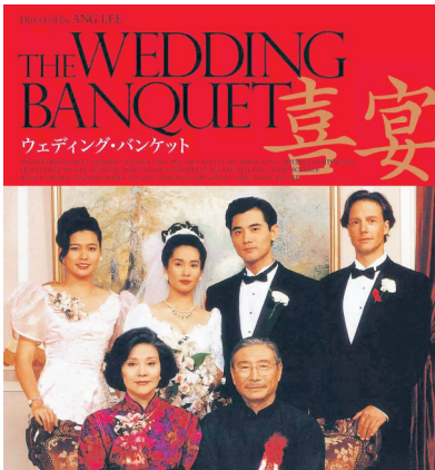
李安凭借《喜宴》获得柏林电影节金熊奖。