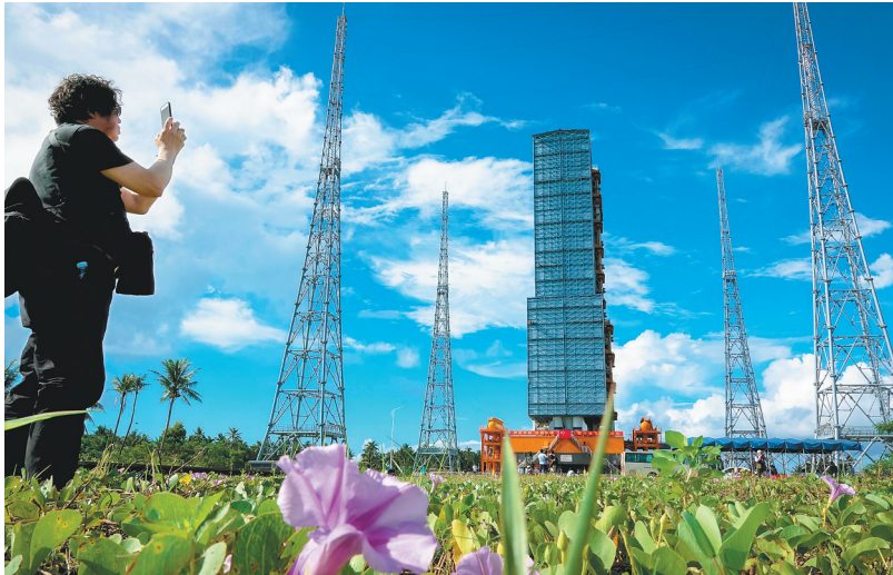
文昌航天发射场风光。

近年来,在省直相关部门指导下,文昌市谋划了航天科研及信息产业、航天重装及商业航天产业、航天技术展示交易及服务贸易产业、航天金融产业、航天生命工程产业和航天科普文化教育旅游创意产业等六大航天产