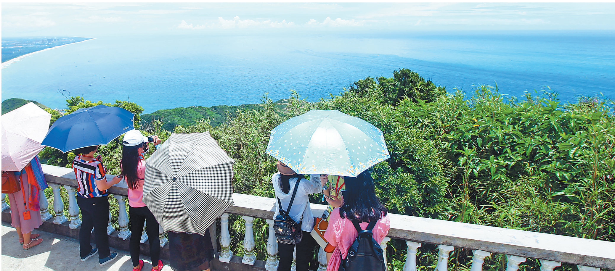
文昌航天特色旅游吸引游客纷至沓来,图为游客在文昌铜鼓岭景区高角度一睹月亮湾美景。