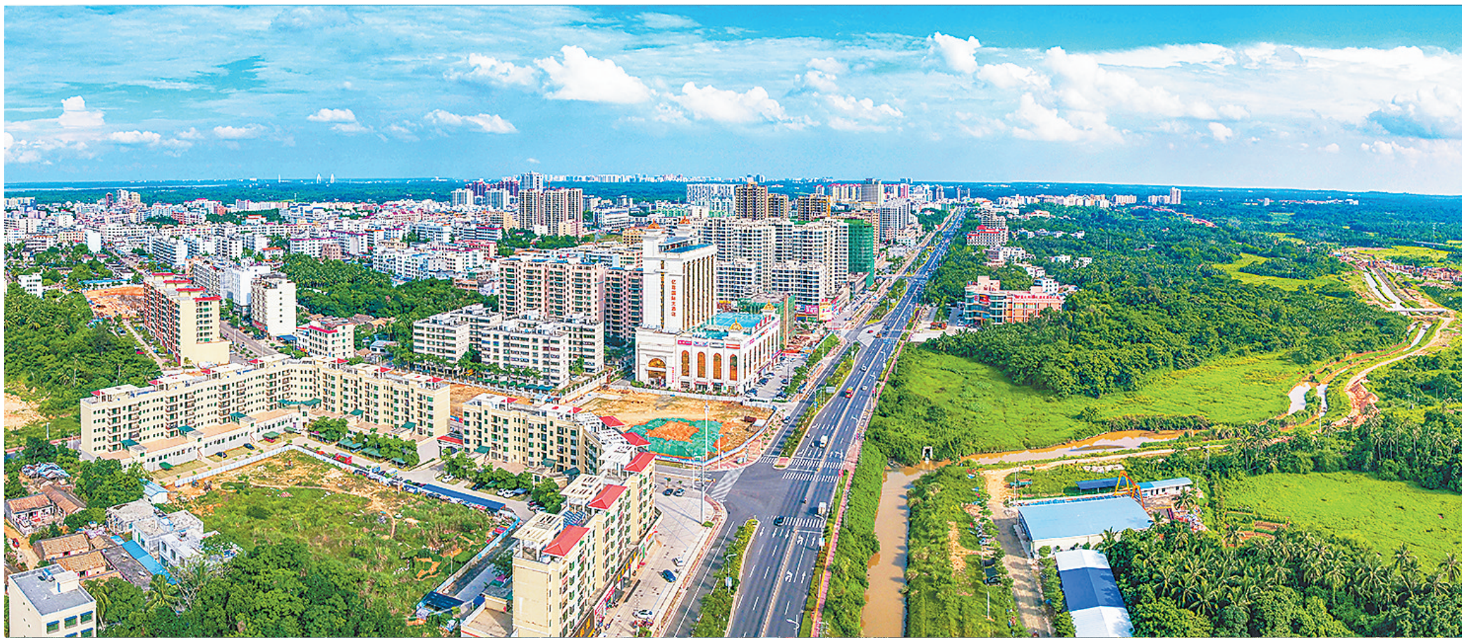
近年来,随着城乡基础设施不断完善,文昌发展软环境也同步提升。