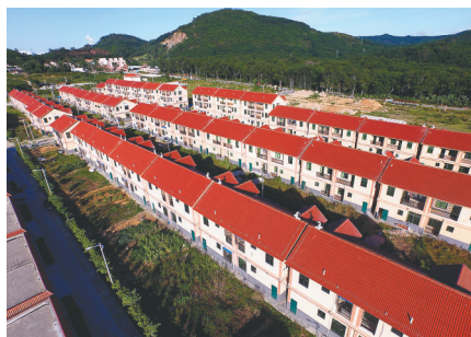
危房改造后的琼中湾岭镇中朗村。