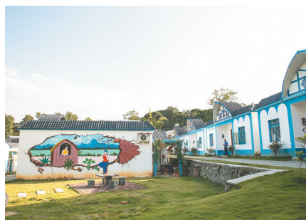
房屋改造后的琼中营根镇猫尾村。

局副局长郑杰文说道，富美乡村、旅游村庄或省美丽乡村示范点（整村推进贫困村）一般农户的危房改造，重建（新建）由政府给予每户补助5万元，修缮加固的给予每户补助1.5万元。 随着农村危房改造力度不断加大，琼中农村的基础设施配套日趋完善，农村环境卫生综合整治逐渐加强，昔日的贫困村成了海南中部山区乡村旅游目的地，越来越多的游客愿意来到琼中，感受黎苗文化。 琼中县委书记孙喆表示，打造全域旅游，共建富美乡村，打好脱贫攻坚战，琼中正在通过县委、县政府、各乡镇各机关单位和全县黎族苗族同胞们的共同努力，让村民在青山绿水中住上“安居”。（本报营根12月11日电）