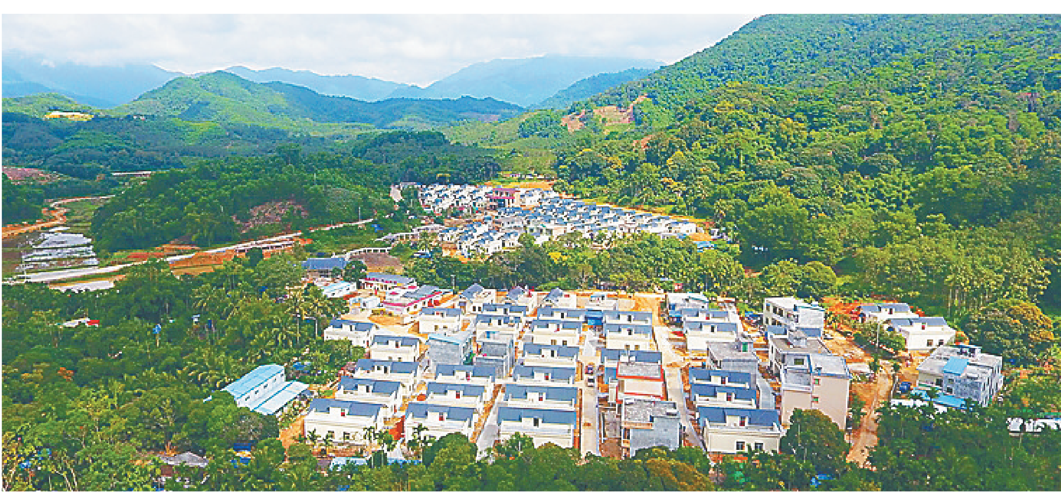
危房改造后的琼中黎族苗族自治县营根镇朝参村。