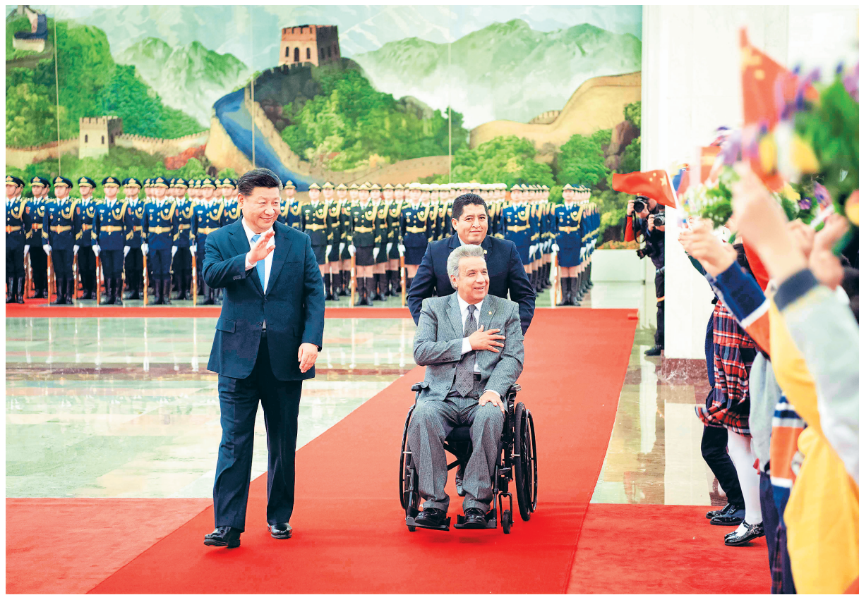
习近平在人民大会堂北大厅为莫雷诺举行欢迎仪式。

会谈后,两国元首共同见证了中厄两国政府关于共同推进“一带一路”建设的谅解备忘录等双边合作文件的签署。