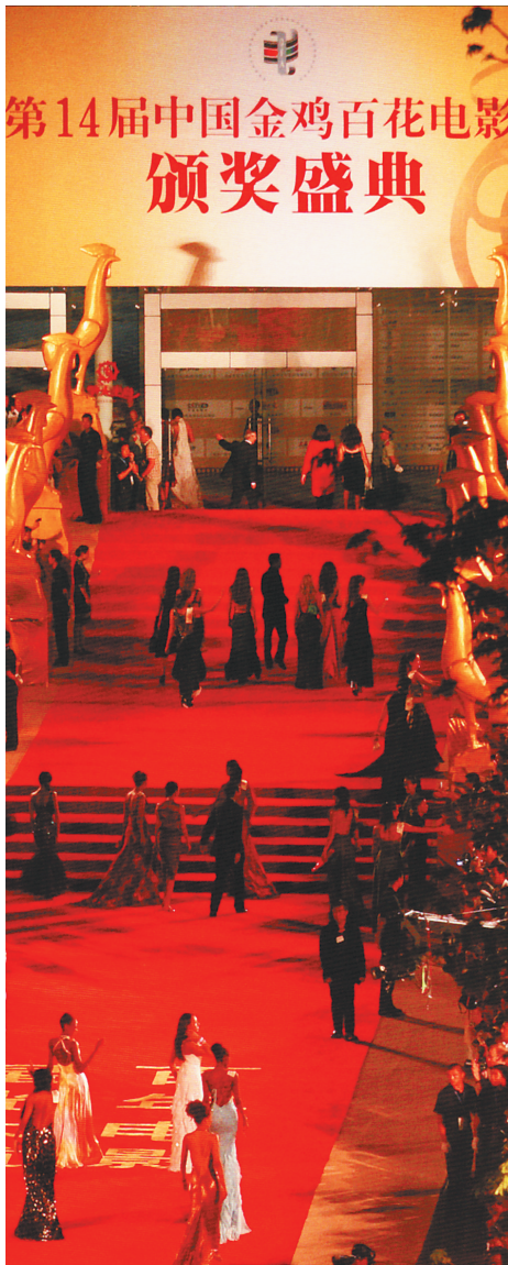
2005年,第14届金鸡百花电影节暨电影百年庆典在三亚举行。

当时,时任中国电影家协会主席吴贻弓表示,作为中国最早开发度假休闲旅游的地区之一,三亚已经拥有了许多举办大型活动的经验。此次电影节的工作让组委会非常满意,也是金鸡百花电影节历史中最有特色、最为成功的一届。