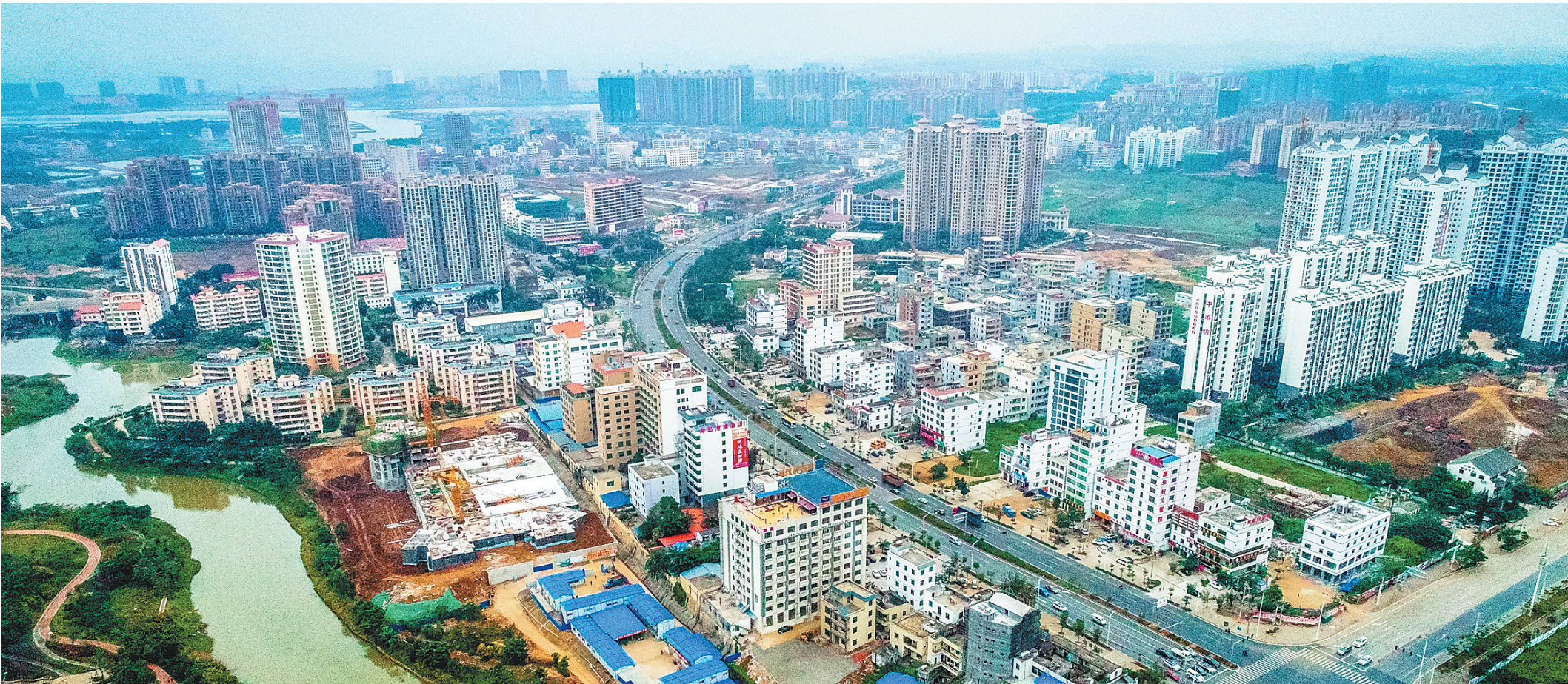
航拍海南老城经济开发区。