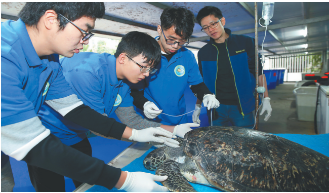
海南师范大学“爱的龟途”项目志愿者为受伤的海龟输液治疗。

据海南师范大学龟鳖研究与保护中心林柳博士介绍，目前，海南师范大学海龟救助站正在救治绿海龟、玳瑁、红海龟等21只海龟，治愈后将陆续放归大海。这些海龟是由执法部门罚没或爱心群众送来救治的。