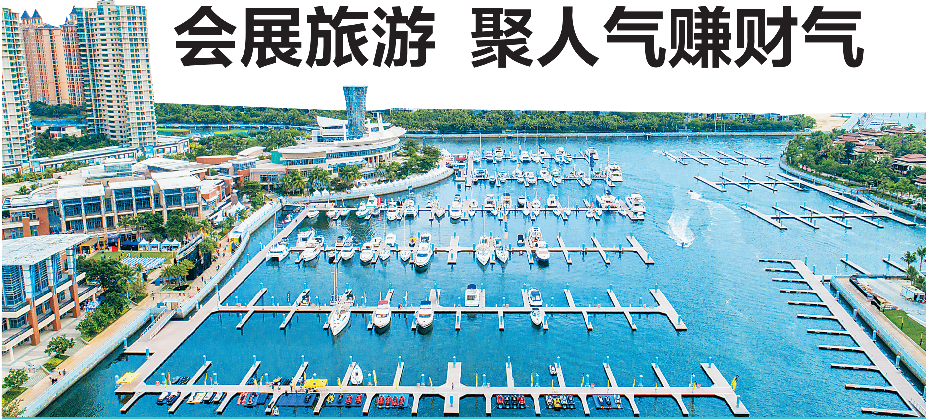
雅航盛世海洋休闲生活博览会在陵水举办。