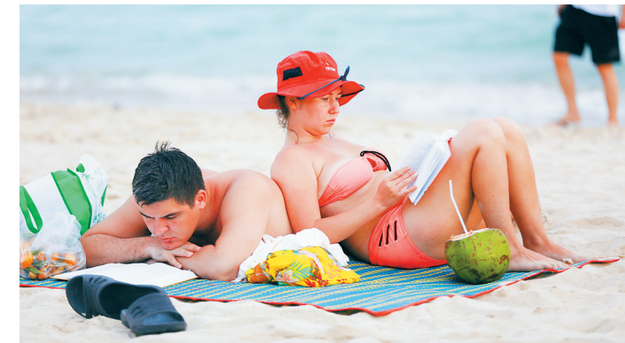
外国游客在三亚海边度假。

陈铁军:三亚在推进全域旅游建设的过程中特别注意到各个“全”。一个是全产业融合,旅游和各个产业进