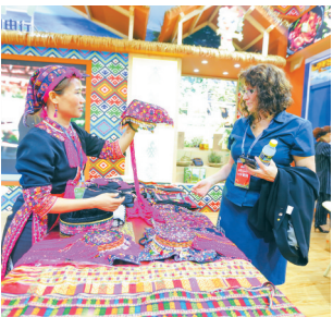
海南世界休闲旅游博览会现场吸引国内外客商观展。本报记者 张茂 摄