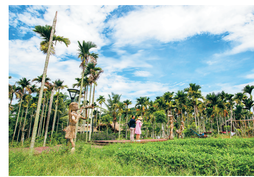
游客在保亭旅游扶贫示范村——三道镇番庭村休闲观光。

“脱贫攻坚惠农超市起到了帮扶和激励作用, 也是贫困农户与普通村民的纽带。超市的出现, 一方面调动了贫困群众脱贫的积极性, 营造多劳多得的劳动氛围, 另一方面广泛动员社会力量, 形成各方参与扶贫的强大合力。”保亭县委书记王昱正说。