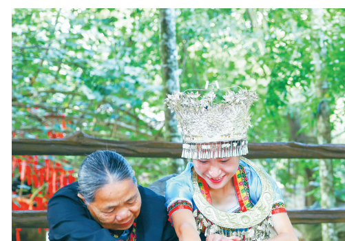
槟榔谷黎苗文化旅游区内, 黎族阿婆教授织锦技艺。近年来, 在景区的带动下, 越来越多的当地群众在景区吃上“旅游饭”。