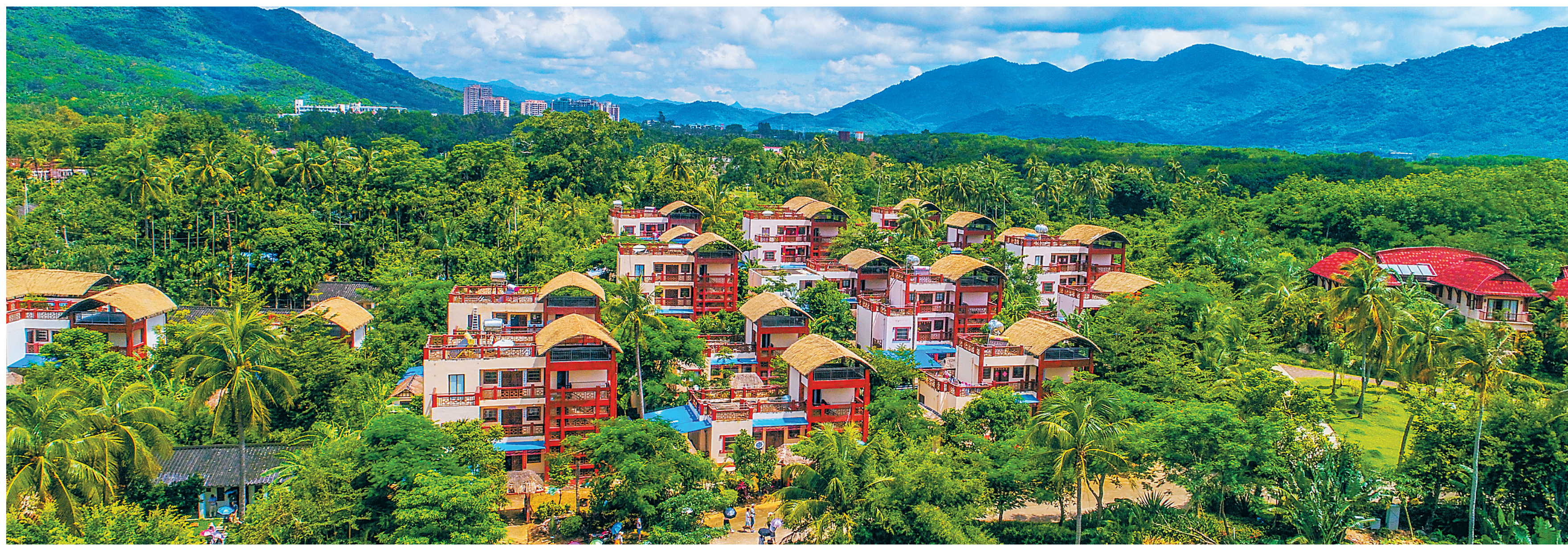
俯瞰保亭三道镇什进村。经过“旅游开发+新农村”建设, 这个昔日的贫困村如今成为布隆赛乡村文化旅游区。